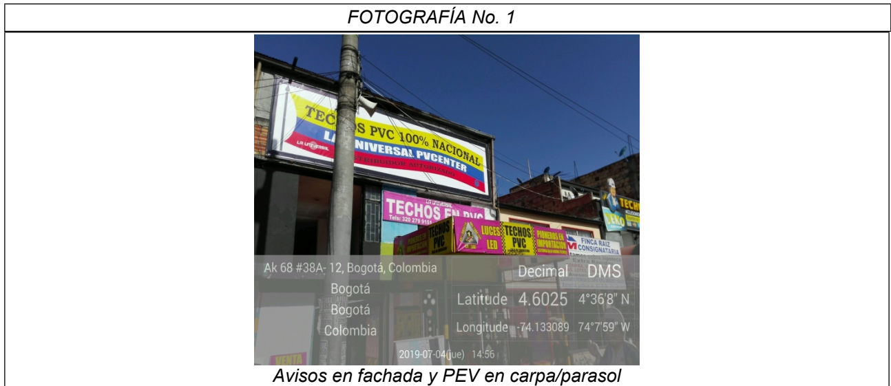
Avisos en fachada y PEV en carpa/parasol