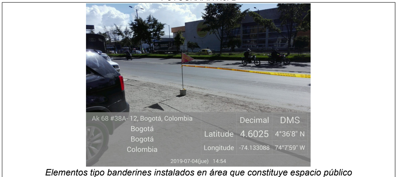
Elementos tipo banderines instalados en área que constituye espacio público